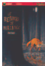
Le Renard de Morlange d'A. SURGET

« Un roman simple mais sympa sur la vie et le sort d'un comte cruel... »