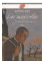
Les Misérables de V. HUGO