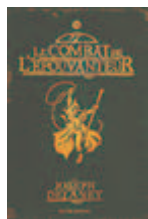
L'Épouvanteur de J. DELANEY